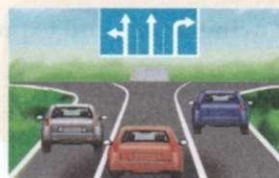
left; straight; right